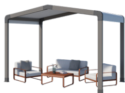
Espace de détente