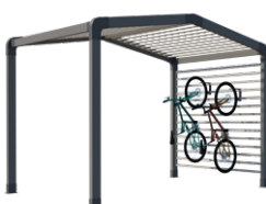
Range-vélos et/ou stockage

Sas d'entrée, espace détente ou de stockage, chambre indépendante, les modul'homes s'adaptent aussi bien aux mobil-homes 1 pente que 2 pentes. Ils peuvent se positionner en pignon, comme un sas ou détaché du mobil-home.